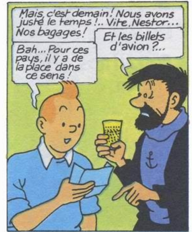
(1) voir "Tientien en Bordélie"